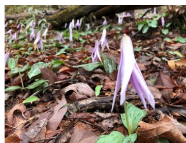
ワサビ谷のカタクリ