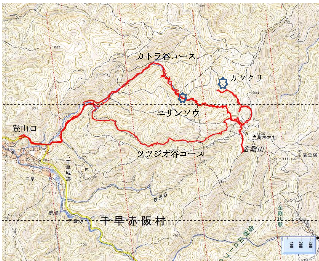
金剛山登山ルート

4月17日20時までにCLが判断し参加者等にご連絡いたします 中止の条件は雨天予報並び新型コロナウイルス感染症等の状況による