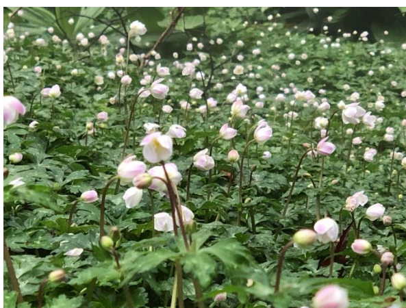
カトラ谷のニリンソウ